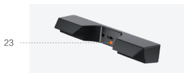
Puerto para iluminación lateral