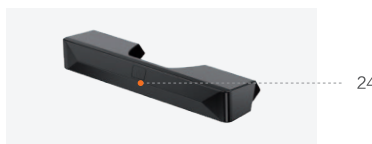
Botón táctil de luces laterales