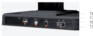
Puertos de conexión